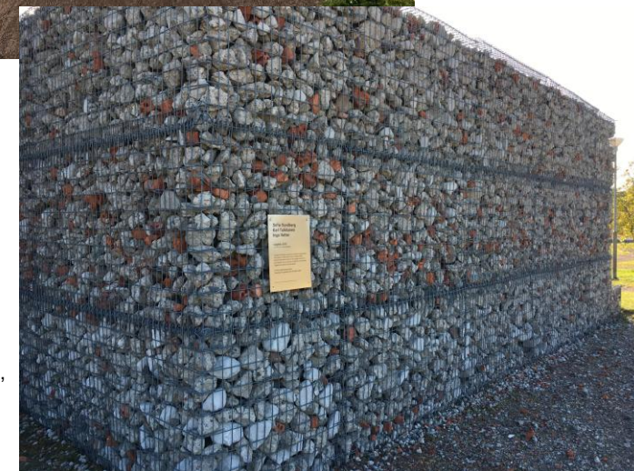
Konstverket Loggbok 2015, av Sofia Sundberg, Karl Tuikkanen & Ingo Wetter